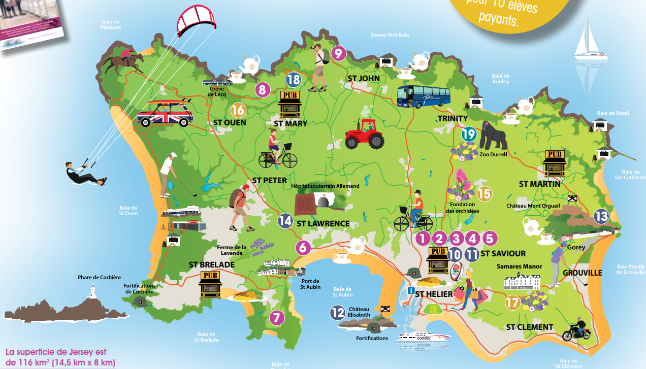
La superficie de Jersey est de 116 km 2 (14,5 km x 8 km)

Gratuités 1 pour 20 adultes payants. 1 accompagnateur pour 10 élèves payants.