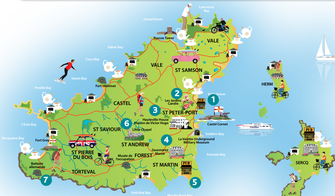
La superficie de Guernesey est de 10 km x 7 km