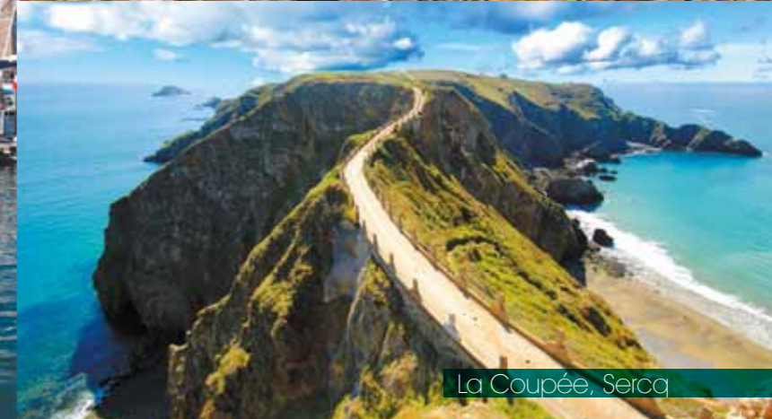
La Coupée, Sercq

A découvrir sans attendre. Unique, accueillante, inoubliable, Guernesey est une irrésistible plongée dans des paysages d'une beauté à couper le souffle et d'un art de vivre à l'anglaise !