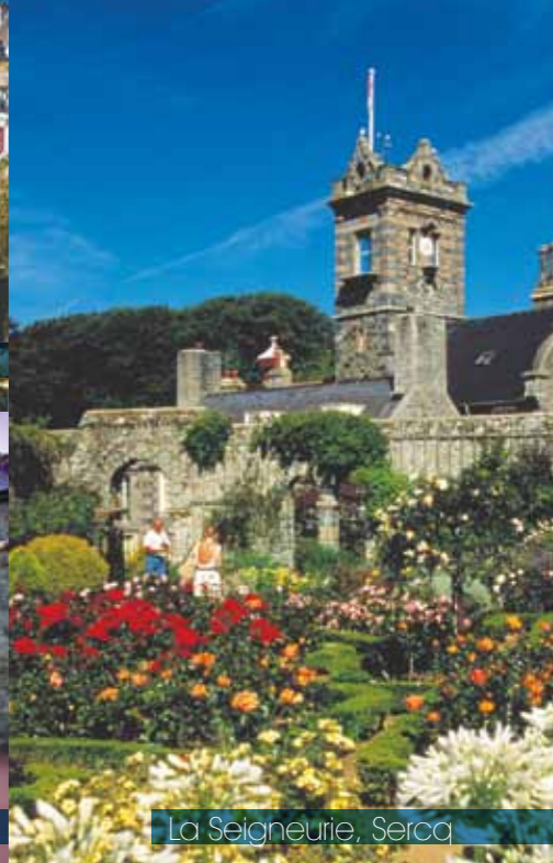
La Seigneurie, Sercq