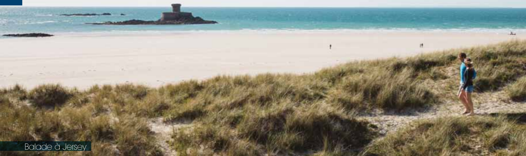
Balade à Jersey