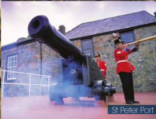
St Peter Port