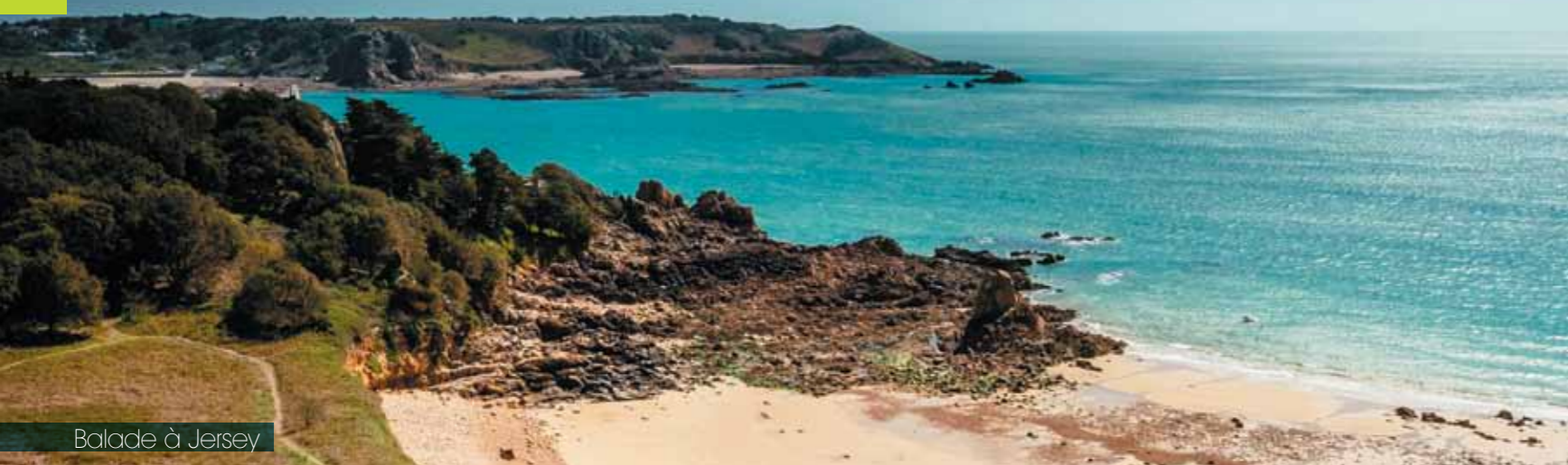
Balade à Jersey