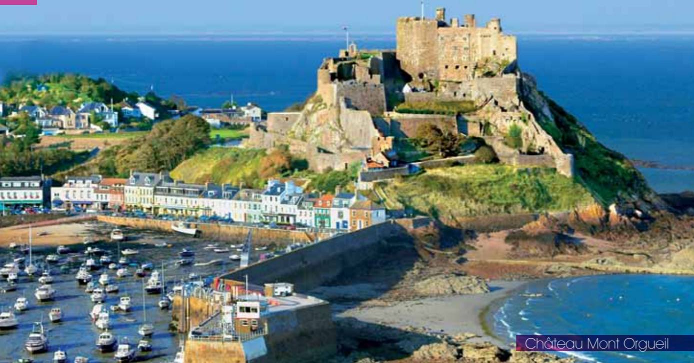
Château Mont Orgueil