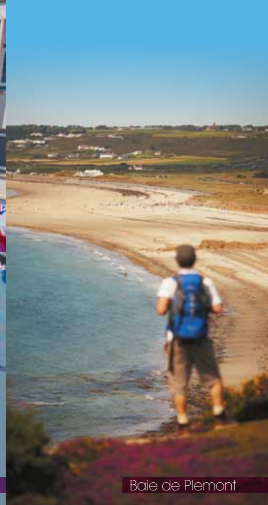
Baie de Plemont

En famille, en amoureux, fan de randonnées, d'histoire, de shopping ou de gastronomie, Jersey découvre ses multiples facettes "So british" au gré de vos envies.