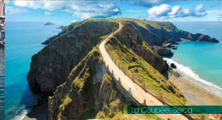
La Coupée, Sercq

A découvrir sans attendre. Unique, accueillante, inoubliable, Guernsey est une irrésistible plongée dans des paysages d'une beauté à couper le souffle et d'un art de vivre à l'anglaise !