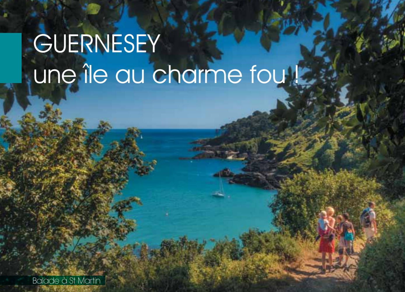
Balade à St Martin