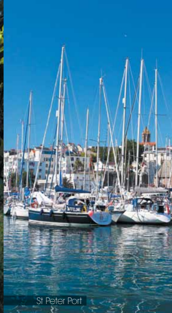
St Peter Port