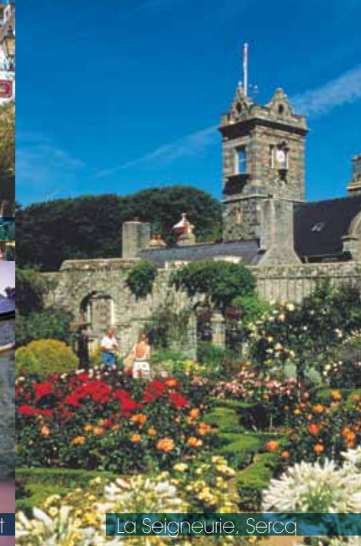
La Seigneurie, Sercq