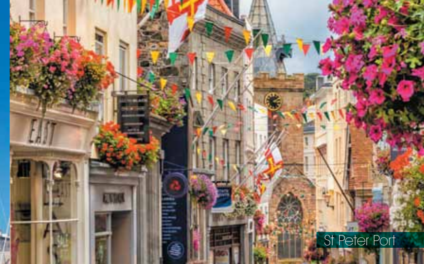
St Peter Port