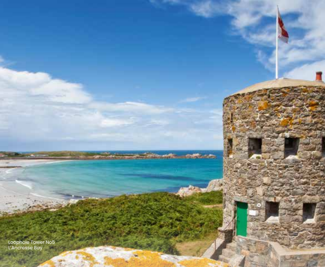
Loophole Tower No5 L'Ancrese Bay