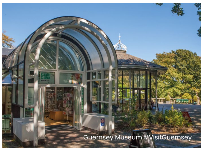
Guernsey Museum

Ce musée présente des collections permanentes qui éclairent l'histoire de l'île et propose régulièrement des expositions temporaires.