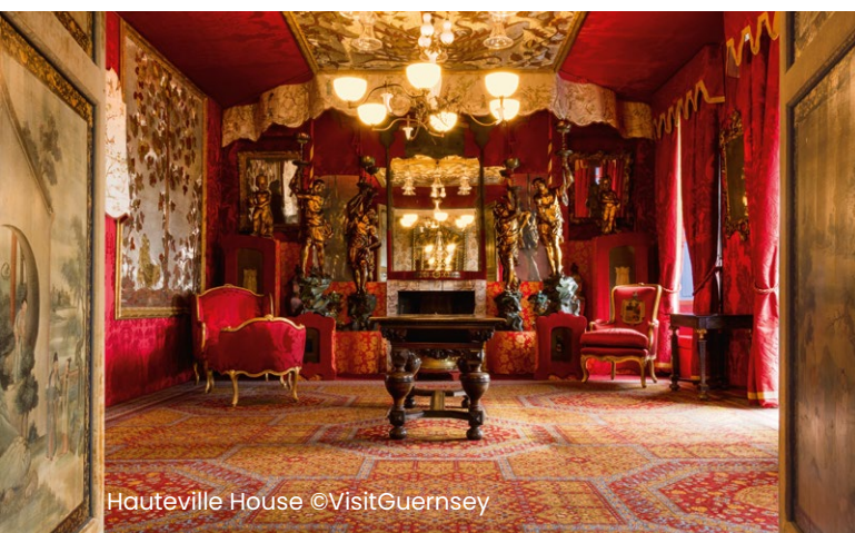
Hauteville House