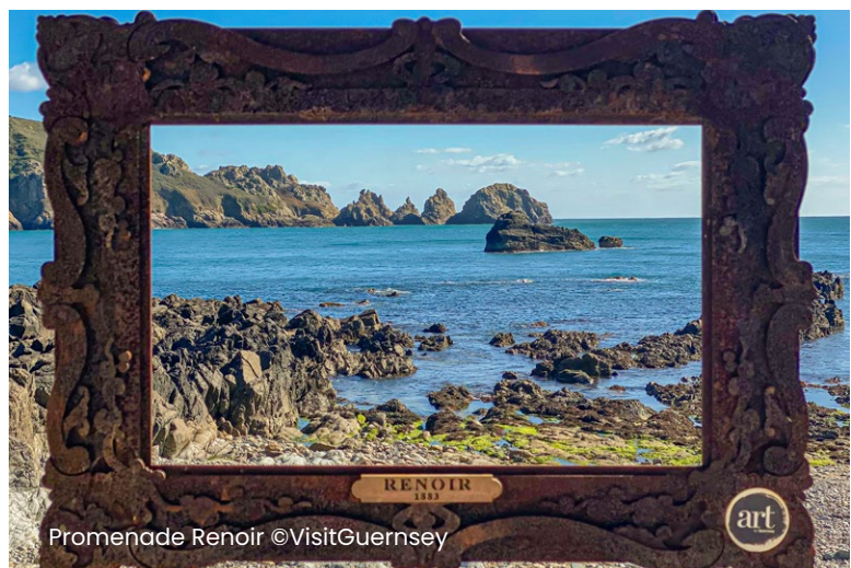
Promenade Renoir

Il abrite plusieurs musées qui racontent l'histoire de Guernesey et offre une vue imprenable sur la ville.