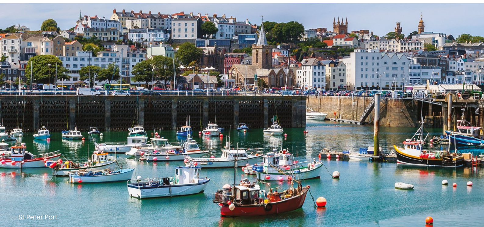
St Peter Port

Formalités : une carte d'identité en cours de validité suffit ! (1)