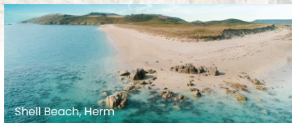
Shell Beach, Herm