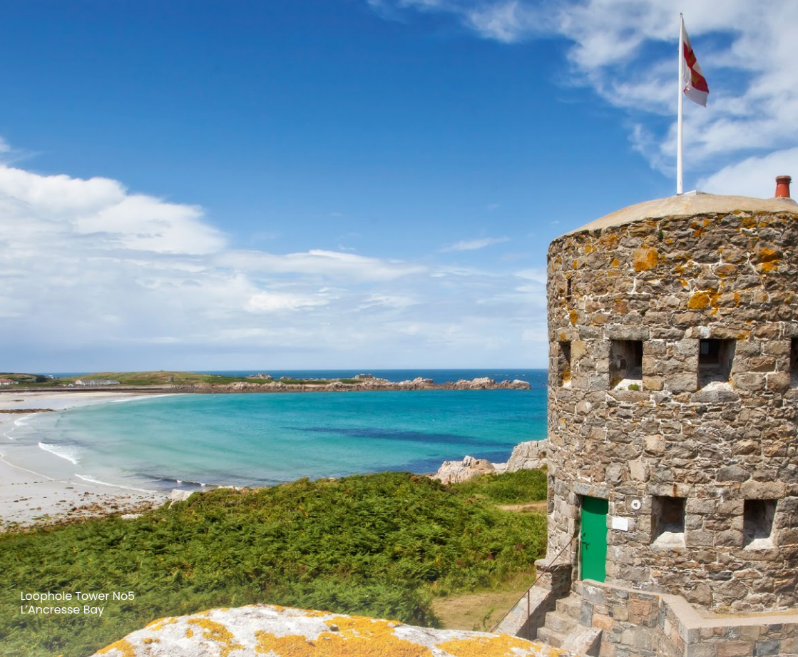
Loophole Tower No5 L'Ancrese Bay