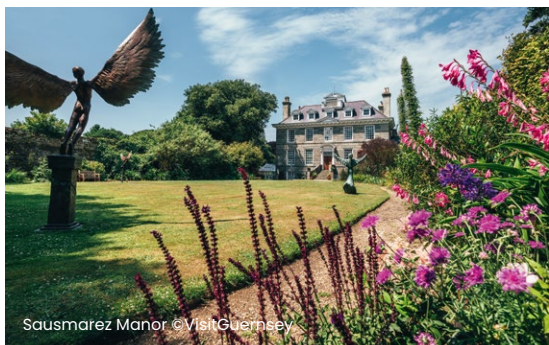
Sausmarez Manor