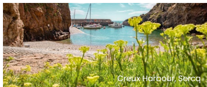
Creux Harbour, Sercq