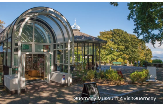
Guernsey Museum