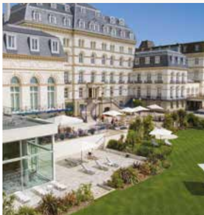
Magnifique piscine et Spa

À ce prix, offrez-vous une escapade d'exception à l'hôtel De France****.