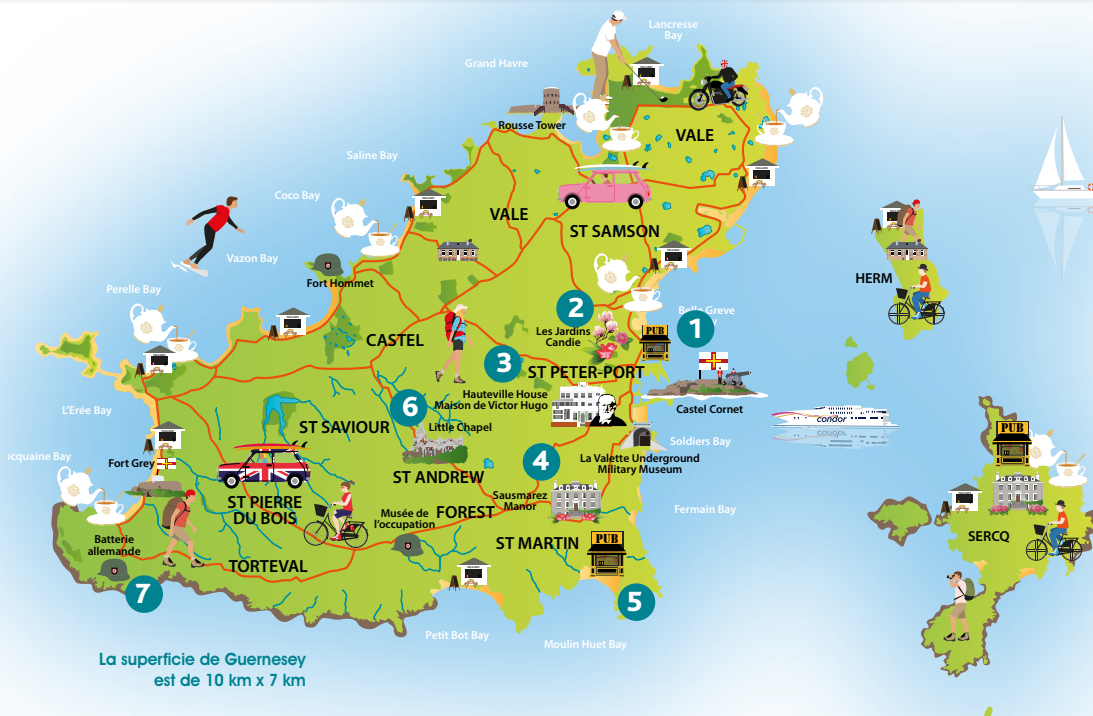
La superficie de Guernesey est de 10 km x 7 km