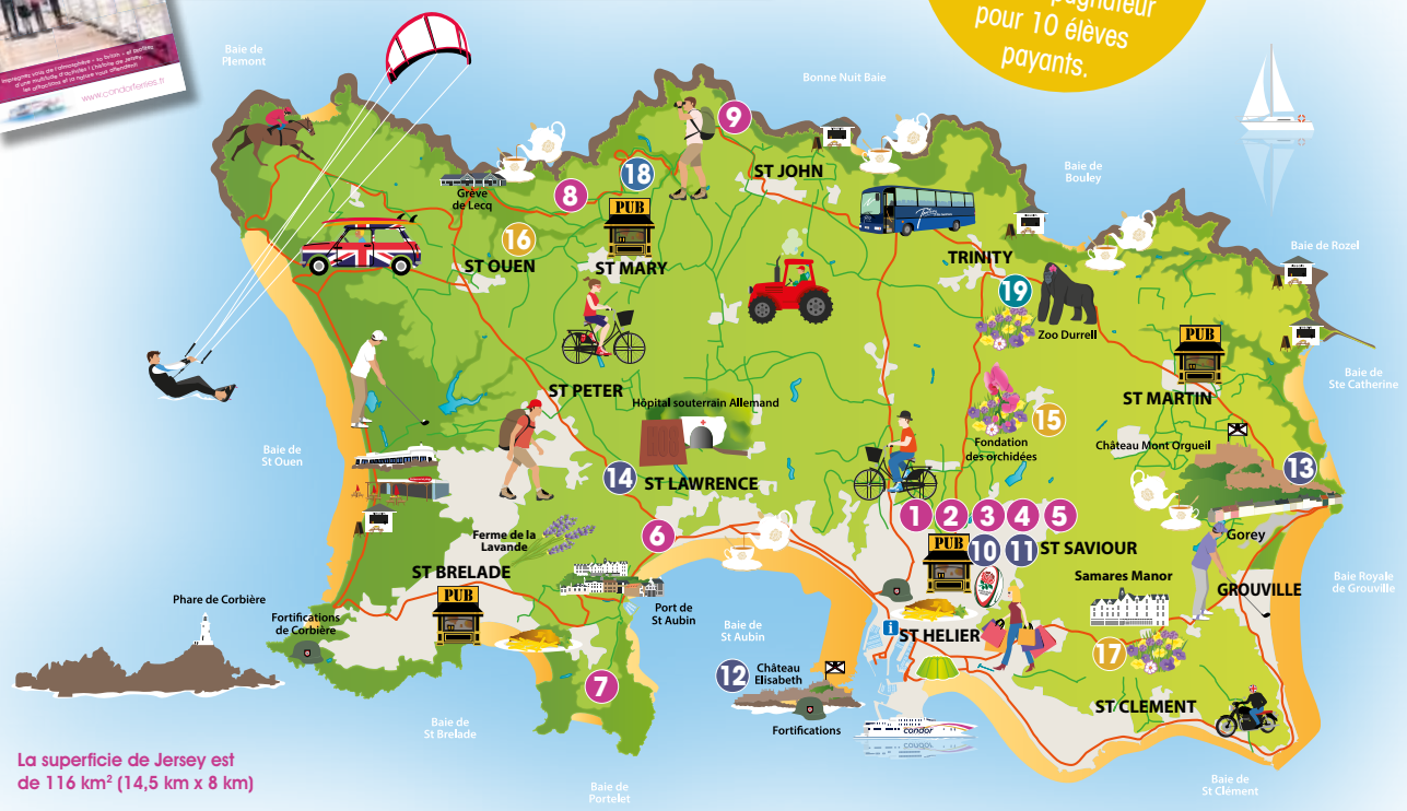
La superficie de Jersey est de 116 km² (14,5 km x 8 km)

Gratuités 1 pour 20 adultes payants. 1 accompagnateur pour 10 élèves payants.